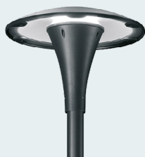
O46 LED 4500 ND2 830 360° OP BLACK NightDim-ohjaus